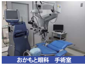
おかもと眼科 手術室

患者様とのコミュニケーションを大切にしながら、今までの経験(大阪赤十字病院や日本赤十字和歌山医療センターなどで白内障手術、硝子体手術、外眼部手術、レーザー手術など手術件数約3,000件)と、最新の医療機器で地域医療がより良いものになることを望んでいます。